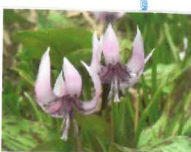
弦谷かたくりの花