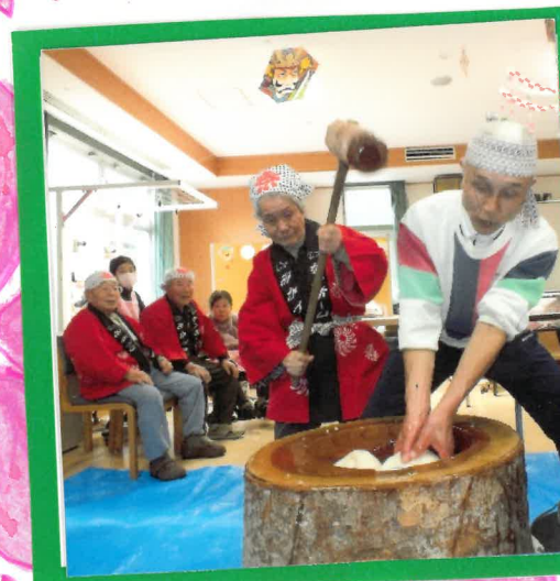
お お餅つき 息を合わせて ペタンコ