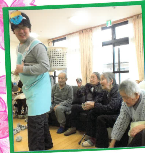
ふ 福は内 鬼退治、幸せドンドン 連れてこい