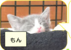
僕は、「もん」。僕の兄弟はここにはいなかったみたい

みなさん、前号のクイズ覚えておられるでしょうか？「八重の里」の(=^・^=)美形四兄弟、誰が、誰の縁続きでしょうか？って、お話です。なかなか難しかったと思います！なんせ、サンホームの職員さんに聞いても、「う～ん、わからんなあ？」って…(・_・)「がんばれ！がんばれ！」と、天国から激が飛びそうです。資料を読み返し答え発見！それでは答え合わせといきましょう！！