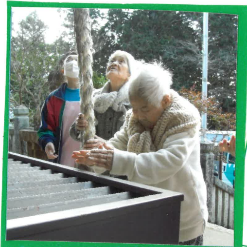
は 初詣 「日岡八幡神社」様 今年もたのんます