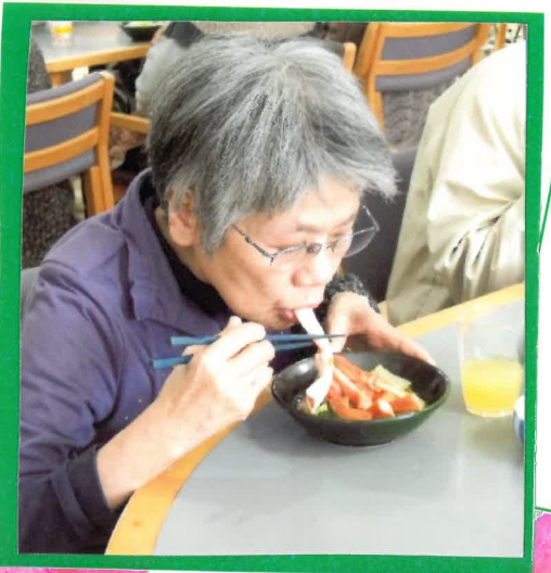
な 鍋の日 寒い日に温か蟹す きで舌つつみ