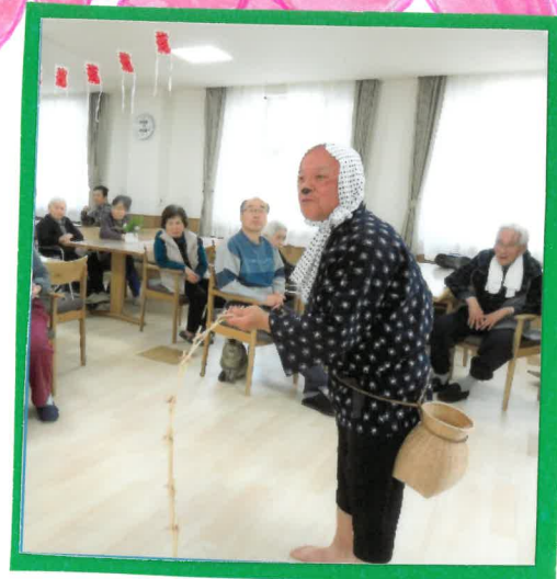
ど どじょうが逃げた と大笑い