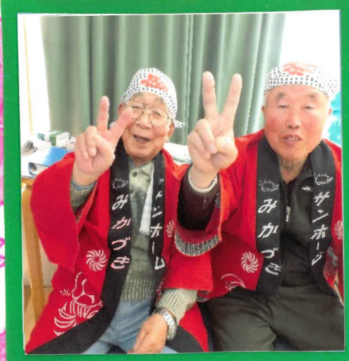
と 友達と 会うのが一番の 楽しみ