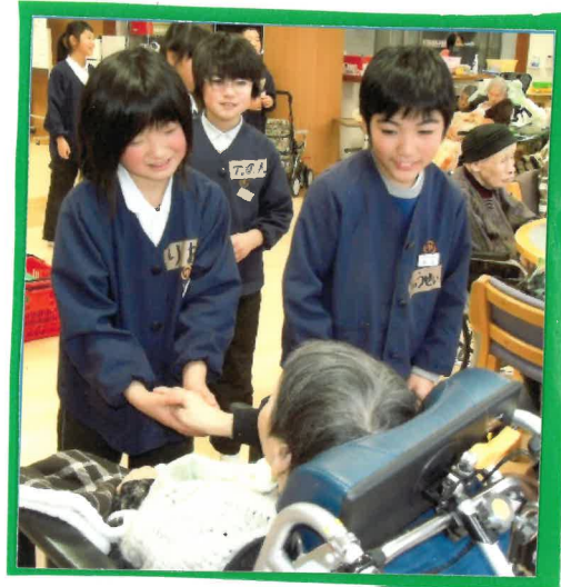
こ 交流会 小さな手が百倍の 元気を頂けた