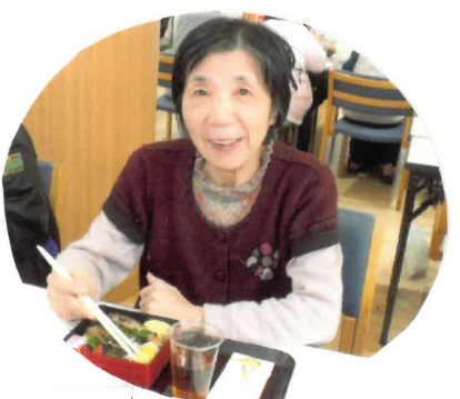
美味しいおせち料理で新年を祝い、新春カラオケ大会で、楽しいひとときを過ごされました。