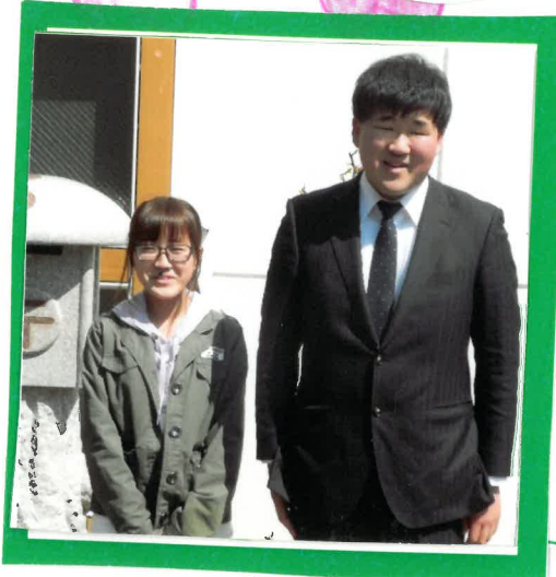
し 新卒職員 ピカピカの笑顔で 頑張ります